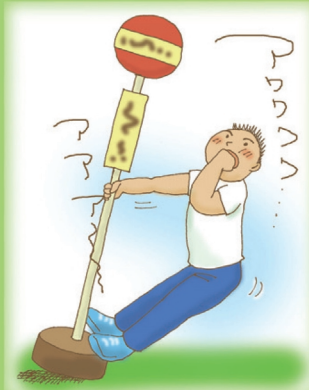
大声を出したり、走り回ったり・・・