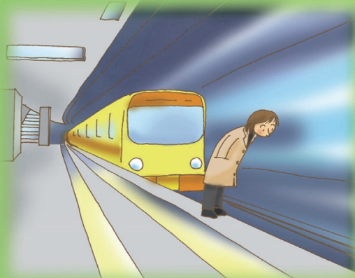
白線を越える危険な行為