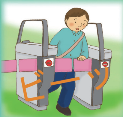
切符や割引証を持たずに乗降・・・